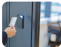
セキュリティドア 2024年秋 リリース予定